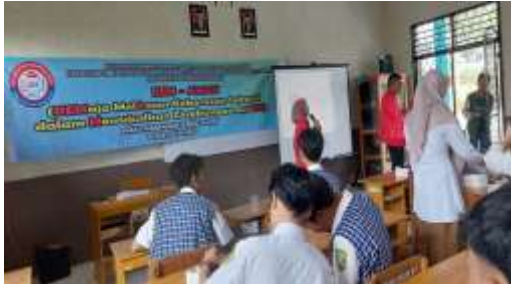
Gambar 1. Kegiatan Pengabdian Masyarakat

Kegiatan tersebut berjalan lancar dan kondusif. Jumlah peserta yang hadir dalam pelaksanaan kegiatan ini adalah sebanyak 37 orang siswa/i terdiri dari (18 Laki-laki, 19 Perempuan) dengan distribusi umur 16 tahun 7 orang, 17 tahun 26 orang, 18 tahun 2 orang dan 20 tahun 2 orang.